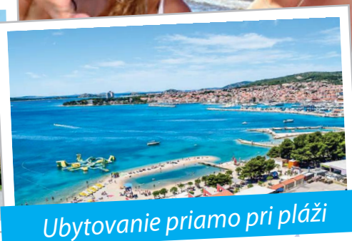
Ubytovanie priamo pri pláži